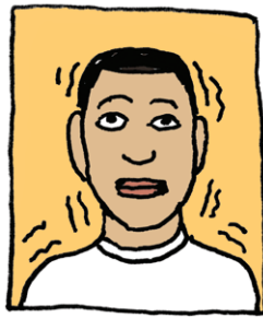
Temblores o mareos