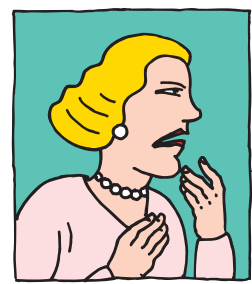
Ira o nerviosismo