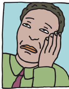
Dolor de cabeza