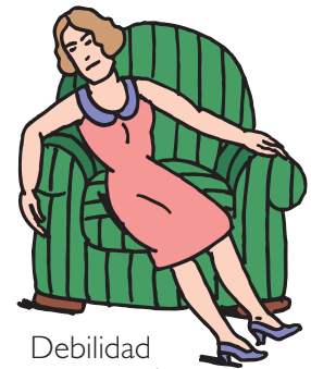
Debilidad o cansancio